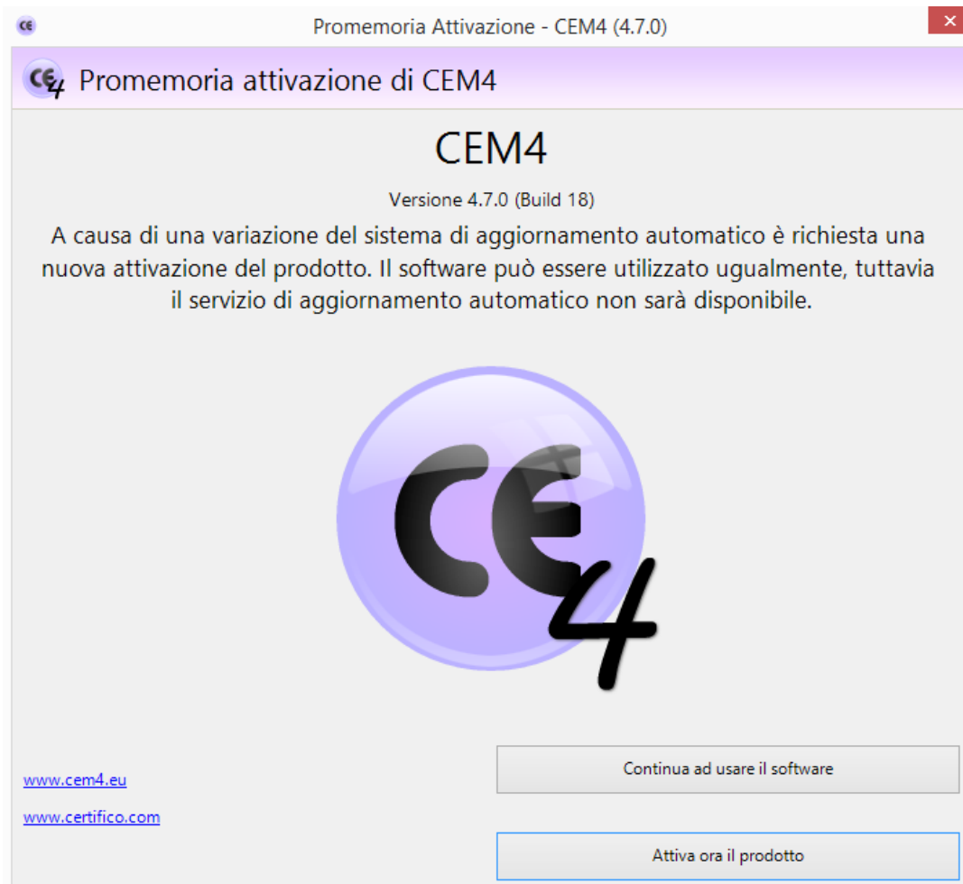
1. Schermata generale

Al lancio di Certifico Macchine 4 è visualizzata la Schermata generale (1) :